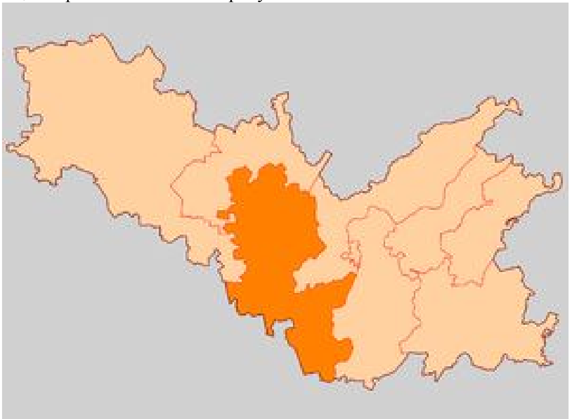
Рисунок 2. Расположение сельского поселения «станция Старица» на карте Старицкого района.

Расположение сельского поселения «станция Старица» на карте Старицкого района показано на рисунке 2.